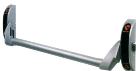
Tableau des références produits

Fermeture antipanique série 6810. 1 point, 1 pêne médian latéral. Existe en coupe - feu et non coupe - feu. Norme EN 1125.