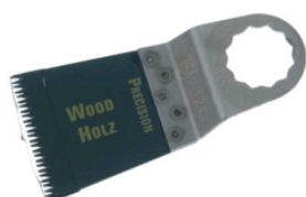
Tableau des références produits

Denture japonaise originale double, pour des coupes de haute précision et des arêtes nettes, un travail exact, même à main levée.