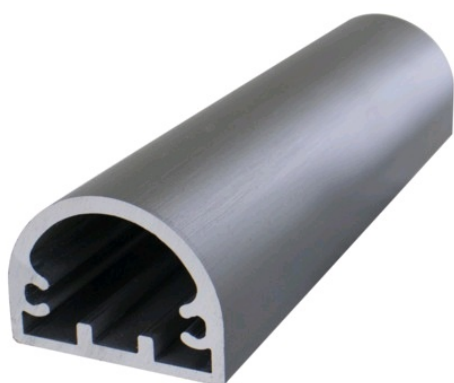
Tableau des références produits