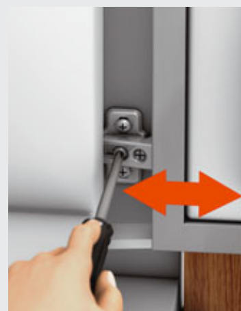
Réglage en profondeur et démontage de la face