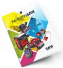
Les outils Indispensables 2021

Découvrez tous nos produits dans nos catalogues en ligne