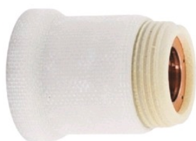
Tableau des références produits