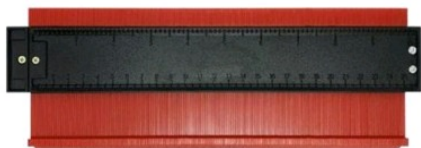
Tableau des références produits