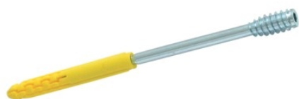
Tableau des références produits

Avec chevilles gratuites dans chaque boîte à partir de longueur 100 mm.